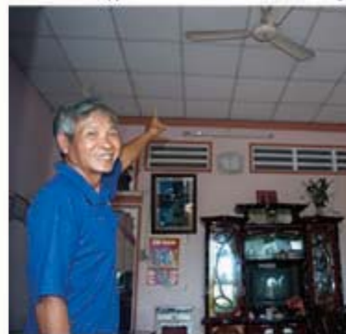
Trần của căn nhà do bác làm đã hơn 10 năm nay

Kỷ niệm thì nhiều lắm chứ, vui cũng có mà buồn thì cũng nhiều. Buồn vì có nhiều khi mình và cả đội thợ cố gắng thi công cho chủ nhà kịp đón Tết, đến cả tôi là giám sát mà cũng phải sấn áo vào thi công nhưng cũng không thể kịp được, làm đến chiều tối giao thừa thì phải dừng để về thôi, khách có nhiều khi không vui, mình cũng thấy ái ngại, nhưng cũng may là họ hiểu vì xây dựng, sửa chữa nhà cửa với tiến độ gấp gáp quá thì phải thế thôi... Còn chúng tôi, làm như thế rồi chạy xe đi 30-40km về đến nhà thì chỉ kịp tắm rửa ăn vội chén cơm là xong giao thừa rồi. Nhưng đó là một số rất ít công trình thôi, còn lại chúng tôi luôn cố gắng hoàn thiện trước Tết cho người ta ăn Tết nữa chứ, và đó chính là niềm vui của nghề, làm xong sớm, chủ nhà vui vẻ với công trình mình vừa làm xong, rồi còn giảm được chi phí công nhật cho anh em... lâu lâu có chủ nhà chơi "sộp" còn có cả tiền thưởng