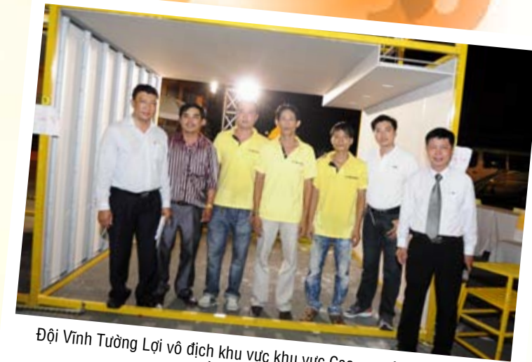
Đội Vĩnh Tường Lợi vô địch khu vực Cao nguyên Duyên hải - Miền Đông - TP.HCM

Số lượng khách tham gia: 447 Số đội tham gia thi lý thuyết: 67 Số khách đổi phiếu mua hàng Gyproc: 381 phiếu. Đội đoạt giải xuất sắc thi tay nghề: Vĩnh Tường Lợi - TP.HCM Đội đoạt giải nhì thi tay nghề: An Tiến Mỹ - TP.HCM Đội đoạt giải ba thi tay nghề: Song Long - TP.HCM Đội đoạt giải khuyến khích thi tay nghề: Hồng Hà - TP.HCM Đội đoạt giải khuyến khích thi tay nghề: Phương Hậu - Đồng Nai Đội đoạt giải khuyến khích thi tay nghề: Nam Linh - TP.HCM Đội có số lượng thợ tham gia đông nhất: Vĩnh Tường Lợi - TP.HCM với 24 thợ tham gia