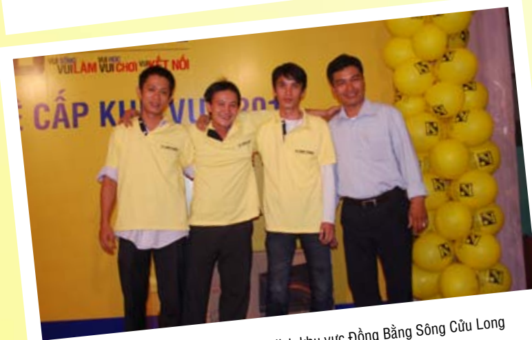
Đội Vĩnh Tường (Tượng) vô địch khu vực Đồng Bằng Sông Cửu Long