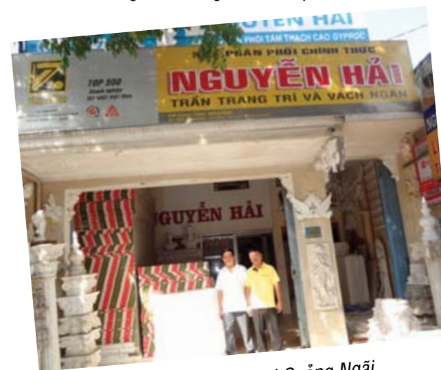
Đến TTPP Nguyễn Hải tại Quảng Ngãi