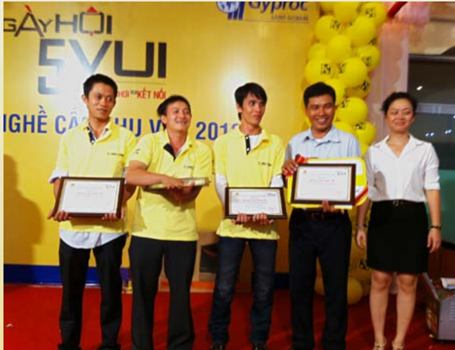
Đội VĨNH TƯỜNG TƯỢNG – Xuất sắc khu vực đồng bằng Sông Cửu Long

Vòng loại cuộc thi toàn quốc “Thợ cả Vĩnh Tường 2012” đã đi được nửa chặng đường từ ngày 1/4/2012 tại TP.Cần Thơ, ngày 08/04/2012 tại TP.Hải Dương và ngày 15/04/2012 tại TP.HCM vừa qua. Qua 3 lần tổ chức, tại mỗi khu vực chúng ta đã tìm ra chân dung của 3 đội bước vào vòng chung kết. Tiếp xúc với ba đội xuất sắc vòng loại khu vực tại TP.Cần Thơ, TP.HCM và TP.Hải Dương, tôi không khỏi xúc động khi niềm vui của họ lan tỏa với những cảm xúc đầy tự hào khi vượt qua 206 đội thợ để giành chiếc vé bước vào vòng chung kết toàn quốc tại Nha Trang.