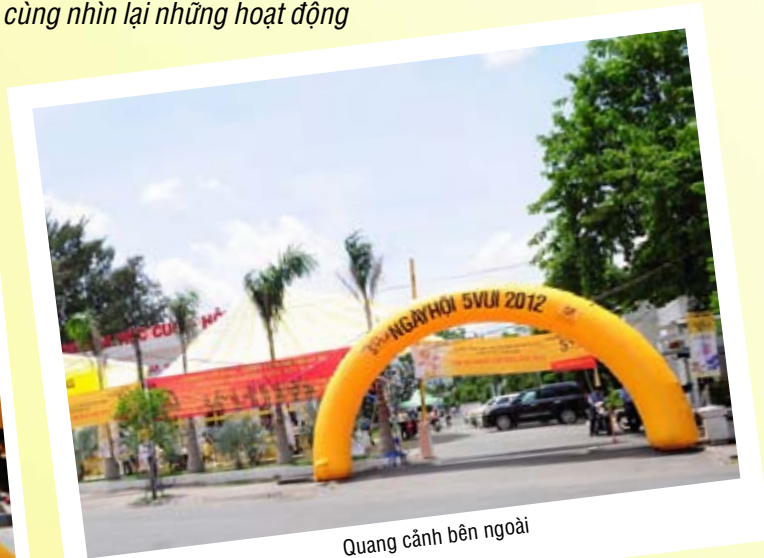
Quang cảnh bên ngoài