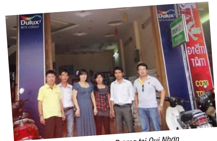
Đến TTPP Đông Dương tại Qui Nhơn

Và Chị cũng vẫn nhắc đến Anh Dũng với tình cảm trân trọng Các bạn thấy đấy dù ít thợ thi công chỉ có giám sát và nhân viên bán hàng của Đông Dương nhưng đoàn VT vẫn hết mình chuyển giao hướng dẫn thi công khung Basi cho họ. Và rồi đoàn chúng tôi lại tiếp tục lên đường để hoàn thành nhiệm vụ của mình. Hầu như trong những ngày này, những bữa ăn của chúng tôi rất thất thường, tiện đâu ăn đó nhưng cũng rất vui vì được sự đón tiếp chân tình của các TTPP của Vĩnh Tường mà chúng tôi đã đi qua.