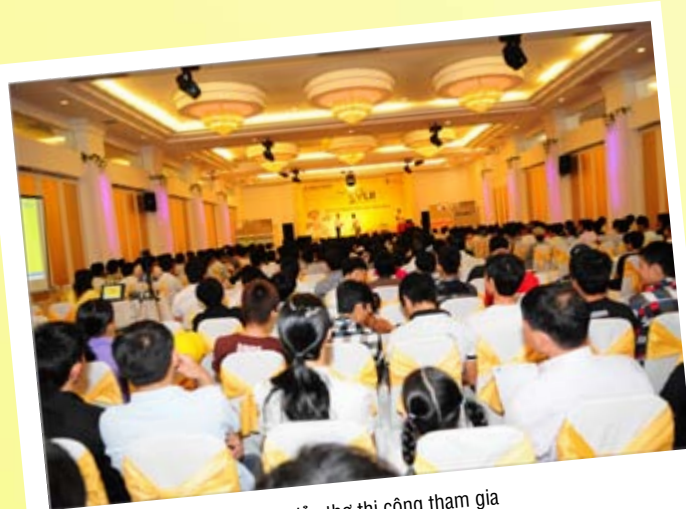
Đồng đạo thợ thi công tham gia