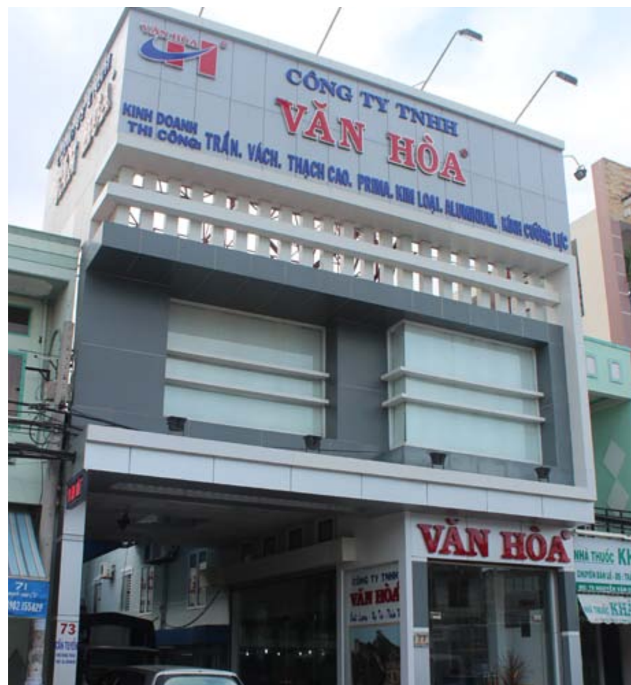
Công ty Văn Hòa tại Cần Thơ

Tôi nghĩ ngành này vẫn rất hấp dẫn và còn phát triển rất tốt. Ngành này ở đây đã vững vàng nên tôi mới chuyển sang alu kính để con cháu có thêm công ăn việc làm. Hơn nữa hai ngành có thể hỗ trợ nhau, cũng là phương pháp giảm thiểu rủi ro. Tôi rất tự tin vào sự phát triển của ngành.