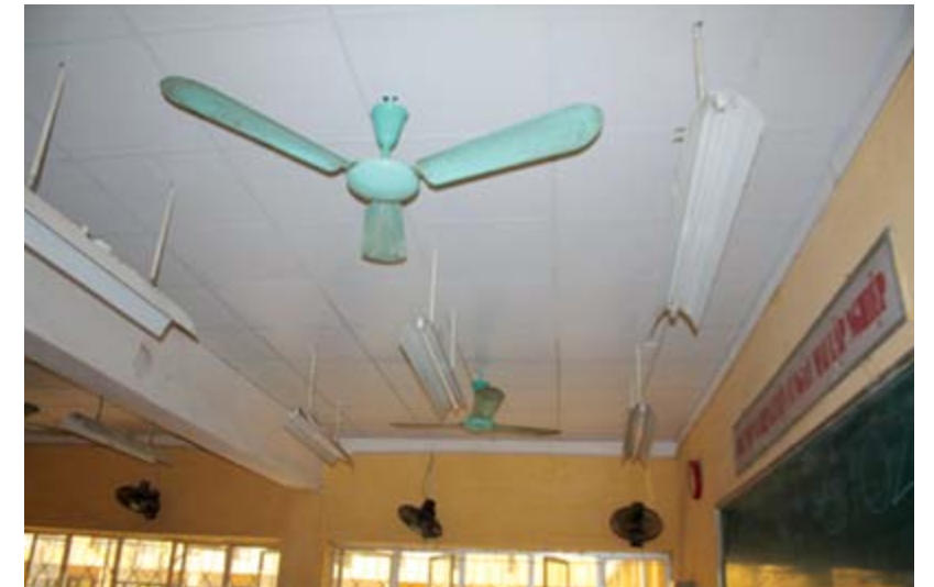
Trần phòng học 101 sau khi được lắp đặt bằng các sản phẩm của Vĩnh Tường

Với tấm lòng tương thân tương ái và truyền thống trách nhiệm vì cộng đồng xã hội, ngay sau khi nhận được tin về tai nạn sập trần tại Trường PPTH Kim Liên trên các phương tiện thông tin đại chúng. Ngày 01/03/2012, đại diện Công ty CP công nghiệp Vĩnh Tường đã liên hệ tới Ban lãnh đạo Trường PPTH Kim Liên và đề nghị tài trợ lắp trần thạch cao mới cho lớp học 101 để thầy cô giáo yên tâm giảng dạy và các em học sinh chuyên tâm học tập. Sau thời gian thảo luận, Ban lãnh đạo Trường PPTH Kim Liên và Công ty CP công nghiệp Vĩnh Tường đã quyết định và lên phương án triển khai lắp trần mới (gồm khung xương và tấm trần của Vĩnh Tường) cho phòng học 101 trong thời gian sớm nhất. Sau khi khảo sát thực địa phòng học 101, đến ngày 06/03/2012, những người thợ thi công trần thạch cao của Công ty CP công nghiệp Vĩnh Tường đã lắp đặt hoàn thiện 54m 2 trần thạch cao mới để lớp học tiếp tục mở cửa đón các em học sinh.