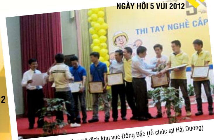
Đội Huyện Quảng vô địch khu vực Đông Bắc (tổ chức tại Hải Dương)

Số lượng khách tham gia: 237 Số đội tham gia thi lý thuyết: 61 Số khách đổi phiếu mua hàng Gyproc: 213 phiếu. Đội đoạt giải xuất sắc thi tay nghề: Huyện Quảng Đội đoạt giải nhì thi tay nghề: Quỳnh Hoàng Phương Đội đoạt giải ba thi tay nghề: Kết Đoàn Đội đoạt giải khuyến khích thi tay nghề: Quỳnh Hoàng Phương Đội đoạt giải khuyến khích thi tay nghề: Cứ Hương Đội đoạt giải khuyến khích thi tay nghề: Cát Tường Đội có số lượng thợ tham gia đông nhất: Quỳnh Hoàng Phương với 70 thợ tham gia