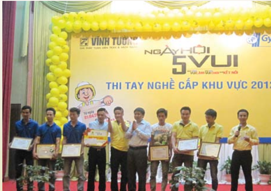
Đội HUYỀN QUẢNG – xuất sắc khu vực đông bắc