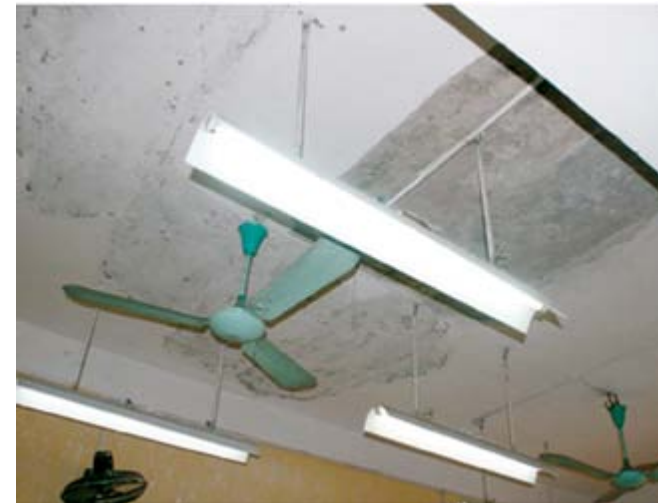
Trần nhà của phòng học 101 cũ và mảng trần bị sụp xuống

Khoảng 9h30 sáng ngày 27/2/2012, trong tiết học môn Toán của lớp 11A8 tại Trường PPTH Kim Liên (Hà Nội), mảng trần rộng hơn 1 mét vuông của phòng học 101 bất ngờ rơi sụp xuống, trúng đầu nữ sinh L. Sau khi xảy ra tai nạn nữ sinh L đã được đưa tới bệnh viện Đống Đa để khâu vết thương.